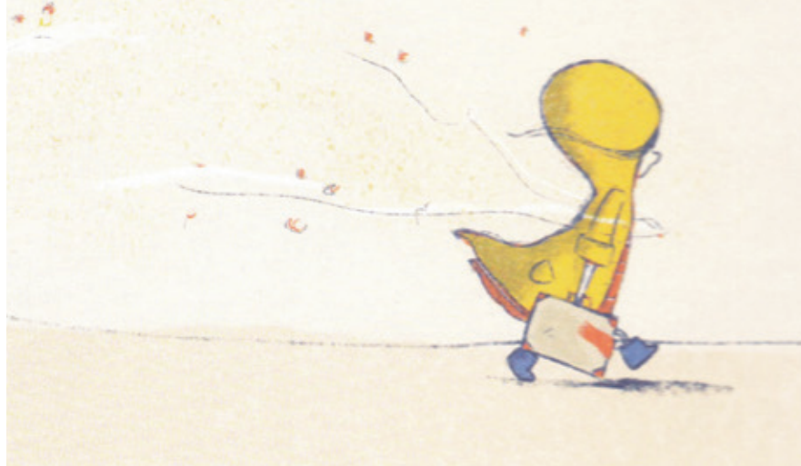
illustratie uit: De wind en wij

Als het verhaal verder gaat, ontdekken we dat we vooral van elkaar leren in goede en roerige tijden. En dan komt de dag waarop we beseffen dat we zijn uitgespeeld. De wind steekt op en je kind gaat zijn/haar eigen weg. Wat is het knap om in weinig woorden en met sobere prenten een ouder-kind relatie te schetsen. Het verhaal en vooral de illustraties doen me herinneren aan het leven met mijn eigen kinderen en laten zien wat ik ervaar als oma nu mijn kleinkinderen hun grote ontdekkingsreis zijn begonnen. Wat is het een ontwikkelingsweg in onszelf; het mogen zijn met en loslaten van kinderen. De wind en wij kan daarom een poëtisch geschenkbek zijn bij het begin van een nieuw leven.